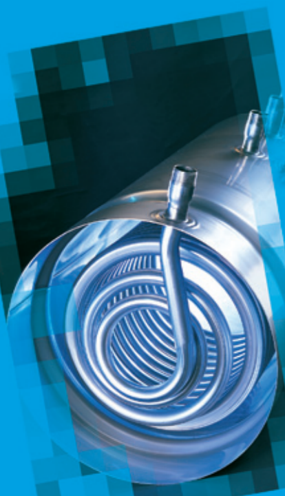
Ballon d'eau chaude VISSMANN Fabriqué à Faulquemont