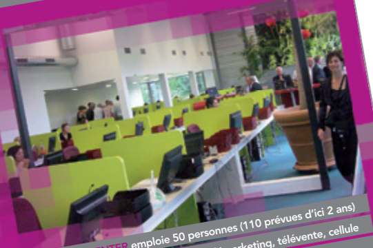
EOS CONTACT CENTER emploi 50 personnes (110 prévues d'ici 2 ans) à Saint-Avold : gestion de service client, télémarketing, télévente, cellule de crise, prise de rendez-vous, qualification de fichiers ...

Moselle Développement et ses partenaires locaux assurent gratuitement un service sur mesure aux investisseurs et aux sociétés déjà présentes en Moselle : - en vous proposant des plateaux tertiaires rapidement disponibles, répondant au mieux aux cahiers des charges - en vous aidant à gérer vos besoins en ressources humaines - en vous offrant une ingénierie technique et financière personnalisée - en facilitant vos démarches administratives - en vous accompagnant tout au long de votre projet