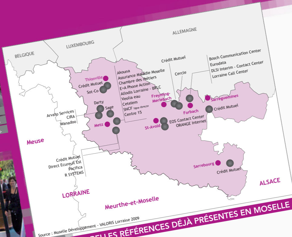
DE BELLES RÉFÉRENCES DÉJÀ PRÉSENTES EN MOSELLE